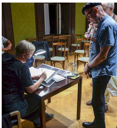
Links: Viele der Besucherinnen und Besucher des Literaturabends ergriffen die Gelegenheit, sich am Ende des Literaturabends Bücher von Ulrike Draesner signieren zu lassen. Rechts: Die Schriftstellerin Ulrike Draesner war am 7. September 2022 in der Guardini-Bibliothek zu Gast bei Erich Garhammer, dem Gastgeber der Reihe Literatur im Gespräch.